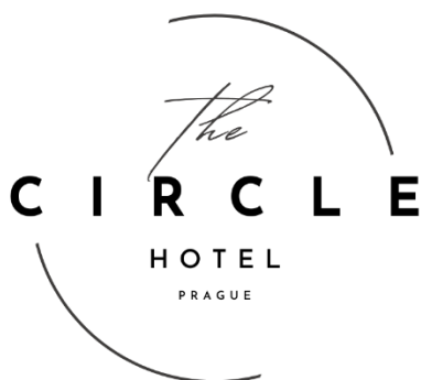
Obrázek 1: Logo hotelu